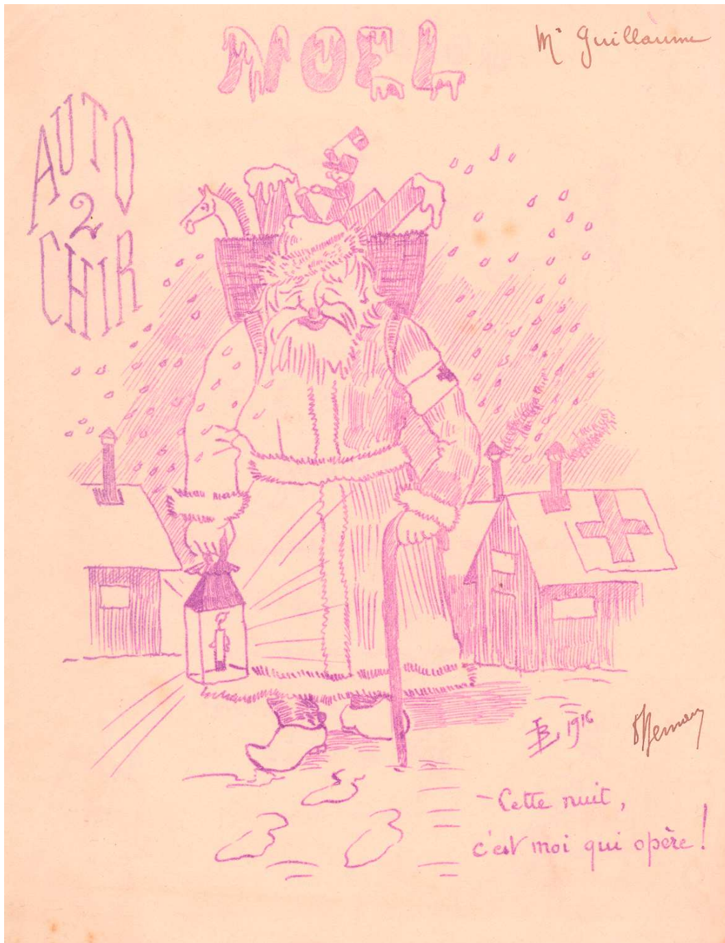
Couverture du menu de Noël à l'autochir 2 (177 J 5)