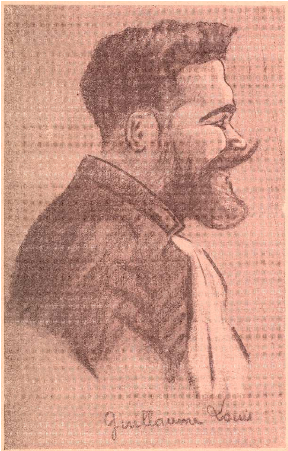
Caricature du docteur GUILLAUME-LOUIS par le docteur BERNARD (177 J 5)